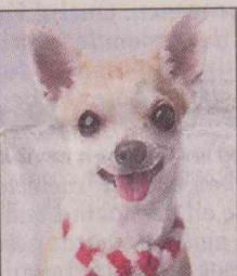
• Chihuahua ...traanoogjes...

maar jongen kunnen werpen. De kopjes van de pups zijn soms zo groot dat de geboorte niet anders kan dan via een keizersnede.